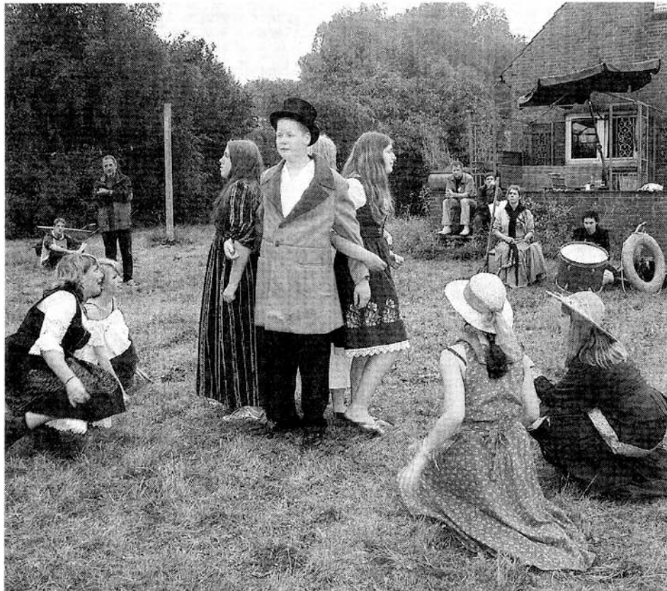
Beim Inselkongress auf Harriersand hatte die Jugendtheatergruppe „Splash“ ihren großen Auftritt. Sie spielte das Stück „Warten auf Medora“.