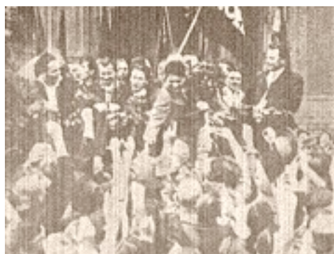
18. Juli 1928: der "Rote Wedding" begrüßt den aus dem Zuchthaus entlassenen Max Hoelz

Am 14. Juli 1928 beschließt der Reichstag eine Amnestie für politisch Gefangene. Am 18. Juli verfügte das Reichsgericht die Freilassung von Hoelz. Aus Verdruss darüber, hierzu gezwungen zu sein, geschah das in Form einer »Unterbrechung der Strafvollstreckung«. Sie bedeutete die Drohung mit erneutem Knast.